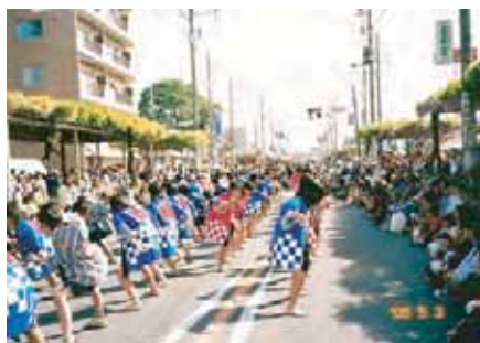
谷原中・ソーラン踊り