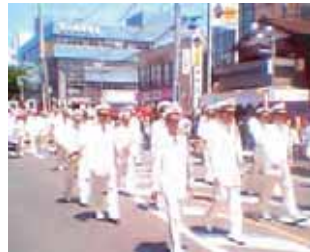
埼玉県警察音楽隊