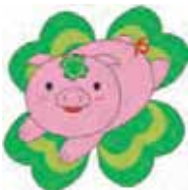
イメージキャラクター 「幸福のブタ」

市議会では 各派代表者会議 (民主党) 議会運営委員会 (オブザーバー) 建設委員 議会だより編集委員 図書室運営委員 都市計画審議会委員