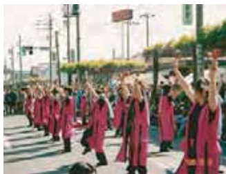
よさこい鳴子踊り