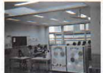
武里南小学校 教室