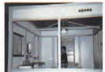
消防本部 地震体験室