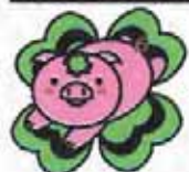
イメージキャラクター 幸福のフタ